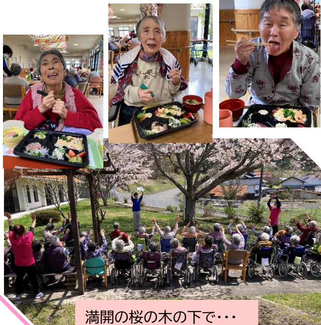
満開の桜の木の下で...