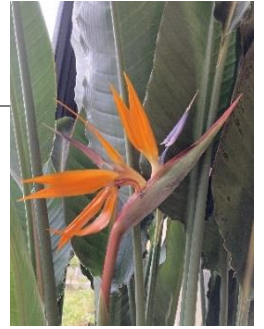
ストレリチアの花が咲く(和名:極楽鳥花)